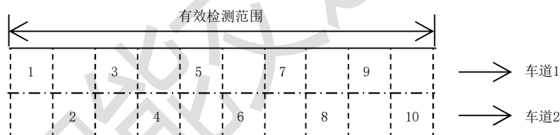
图B.2 模拟事件发生区域