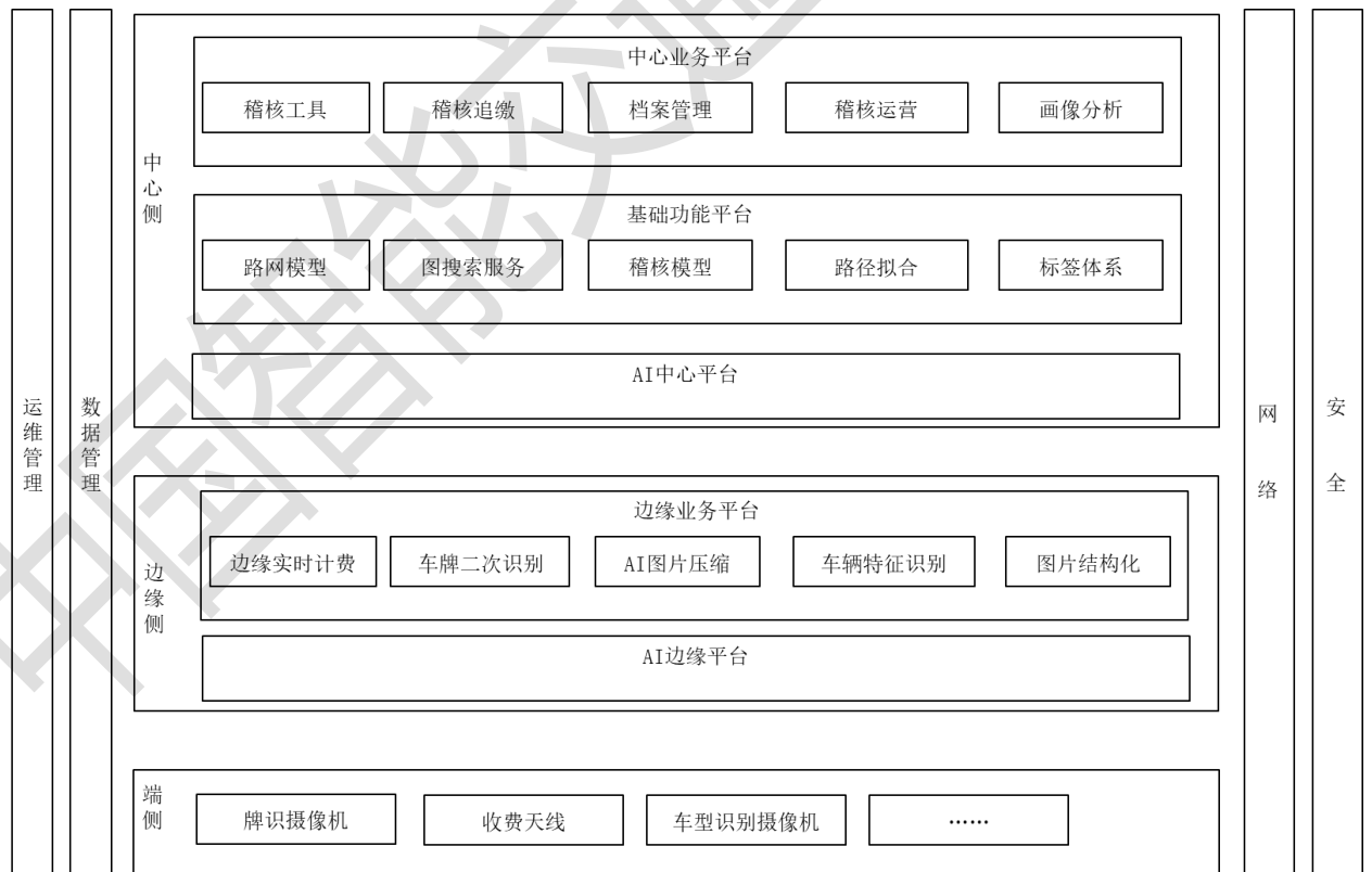
图 1 基于人工智能的收费稽核系统架构