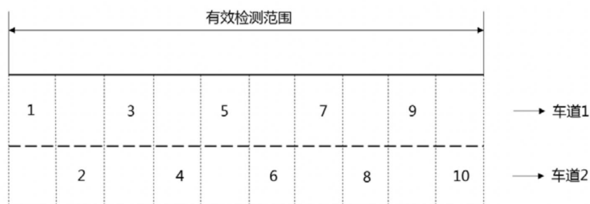
图2 路侧感知检测范围